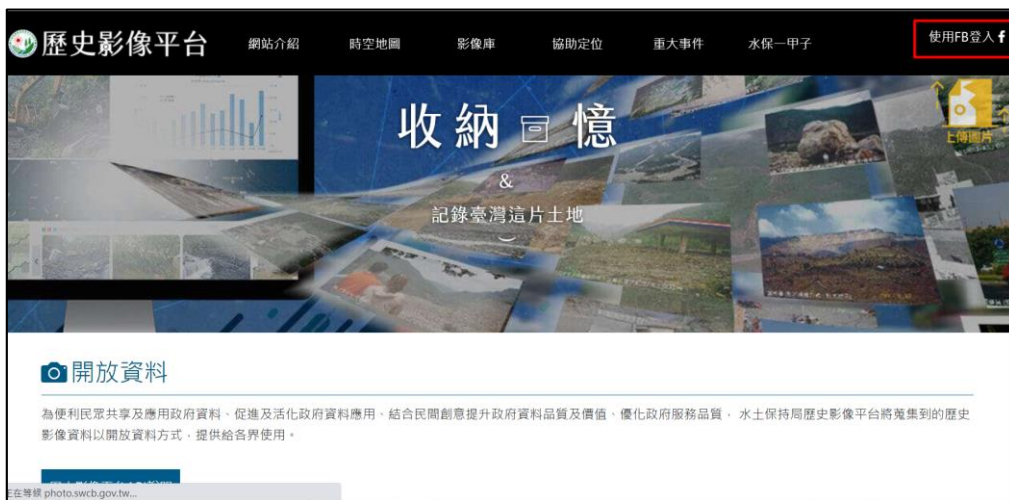
圖 1 歷史影像平台首頁