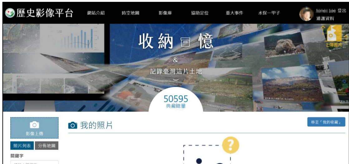
圖 3 完成登入後畫面