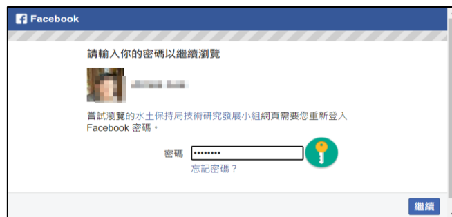
圖 2 鍵入 FB 密碼登入