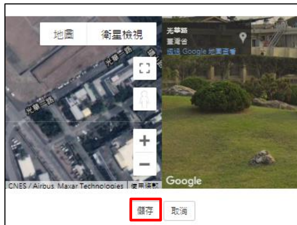
圖 12 點選儲存按鍵