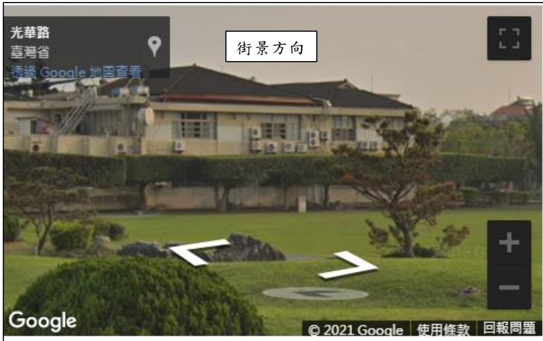
圖 11 Google 街景輔助拍攝方向設定