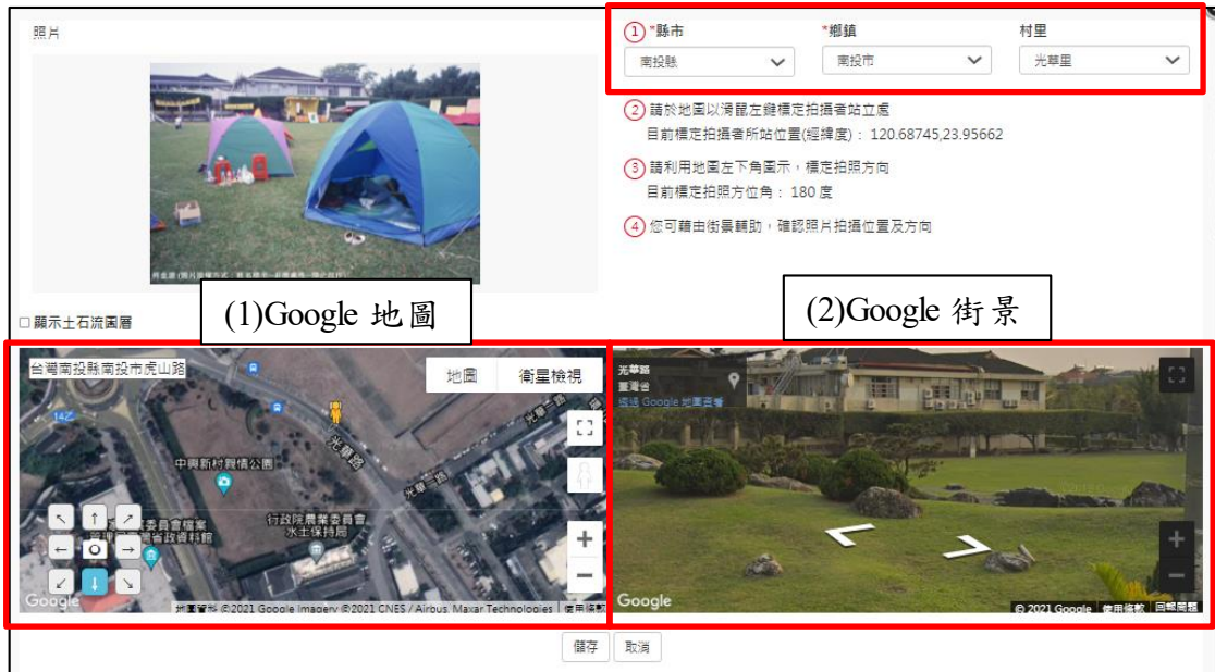
圖 9 選取照片定位

(1) Google 地圖可輸入地標與方向(指拍攝方向)，進行照片定位，如圖 10 所示。