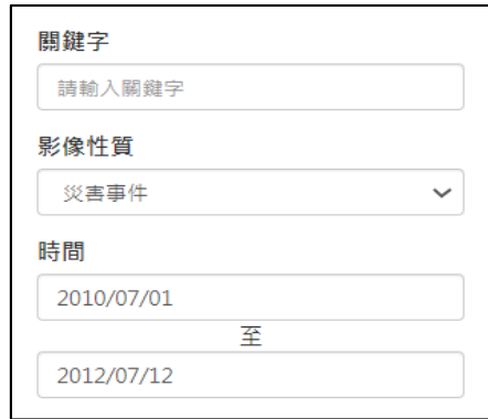
圖 13 資料查詢