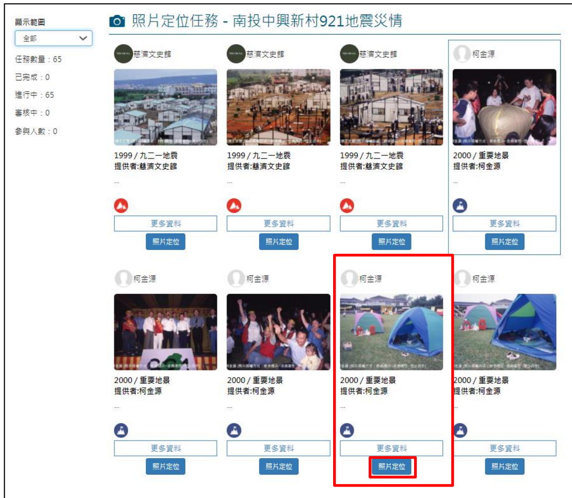
圖 8 選取照片定位

5. 系統提供鄉鎮市區村里進行快速定位，需利用 Google 地圖、Google 街景輔助照片定位，如圖 9 所示。