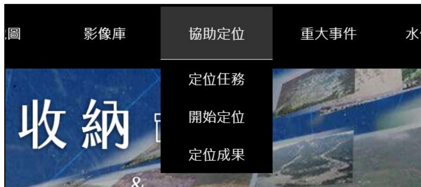
圖 4 協助定位功能

功能列上選取，「協助定位」功能(圖 4)。協助定位共分為「定位任務」、「開始定位」與「定位成果」等三個選項，分述如下。