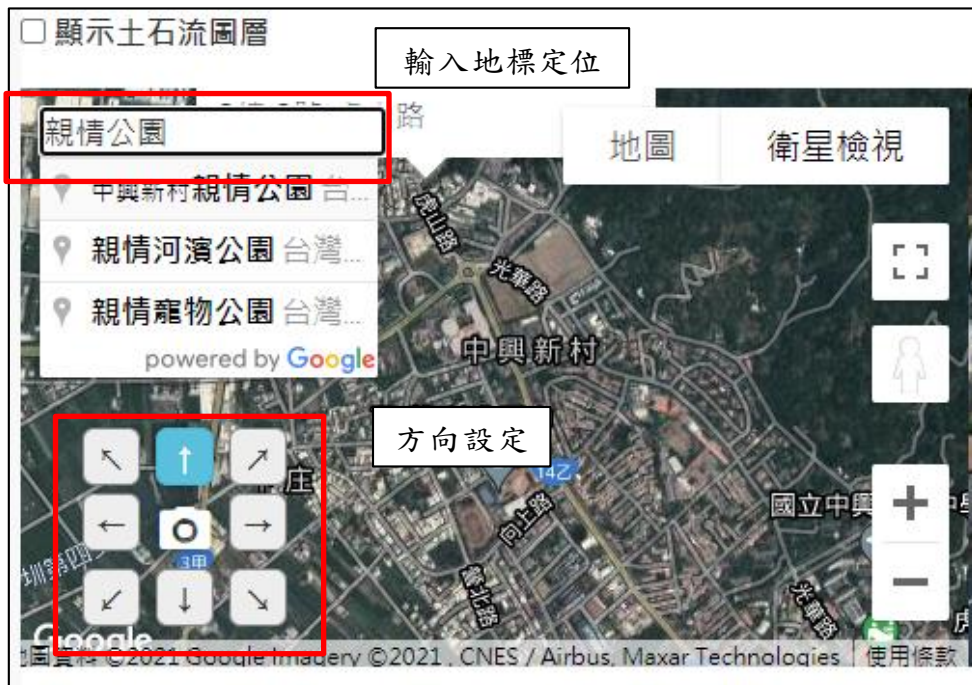
圖 10 Google 地圖輔助定位

(1) Google 地圖可輸入地標與方向(指拍攝方向)，進行照片定位，如圖 10 所示。